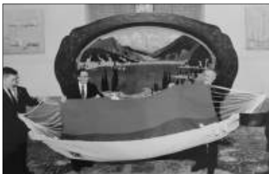
Obsequio al presidente de la Asamblea Popular China, Wang Bangguo, en 2011.