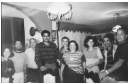
Reunión en San Martín en el año 1998.