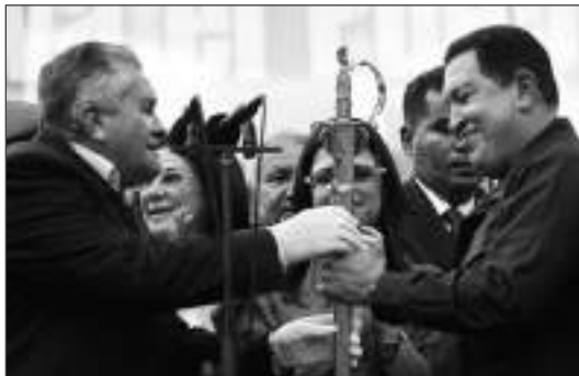
En la Plaza O'Leary del Silencio, Caracas, 5 de enero de 2011.

En 2010 es elegido delegado por la región Caracas al Congreso Extraordinario del PSUV. Es postulado por lista, por el estado Falcón, para diputado a la Asamblea Nacional y en sesión plenaria de este organismo, el 5 de enero de 2011, es elegido presidente de esta para el período 2011-2012. A partir del 2013 formó parte del Mercosur como presidente de la Comisión de Seguridad y Defensa; simultáneamente, en Venezuela es Presidente de la Comisión de Energía y Petróleo 2012-2015, de la AN.