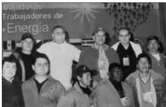
III Foro Latinoamericano y del Caribe. La Paz, Bolivia, hotel Presidente, 24 al 26 de julio de 2007.