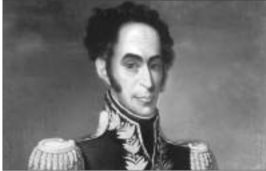
Simón Bolívar, el Libertador.