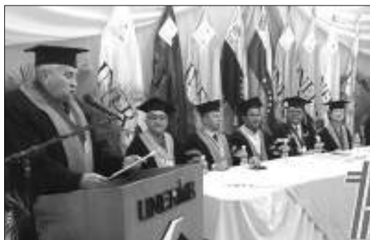
Discurso del 8 de diciembre de 2017 en la sede de la Universidad Nacional Experimental Rafael María Baralt, en Cabimas.

Nosotros, como pueblo venezolano, latinoamericano y caribeño, venimos luchando por nuestra felicidad, independencia y libertad desde hace largo tiempo; en un espacio inseparable de la materia en su permanente movimiento y transformación, con el conocimiento humano tratando de asumir el materialismo dialéctico para despejar incógnitas objetivamente reales. La dialéctica del conocimiento científico es la base para comprender la realidad del mundo, de la sociedad y del pensamiento. La metodología de la investigación-acción facilita el conocimiento de la realidad.