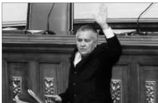
Soto Rojas juramentándose ante la Asamblea Nacional en el 2011.

Buenas tardes, diputados y diputadas electos: