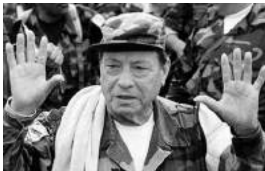
Pedro Antonio Marín (nombre de combate: Manuel Marulanda Vélez), comandante en jefe de las Farc- Ep.

Solo el viento y el agua conocieron su vida y andanzas.