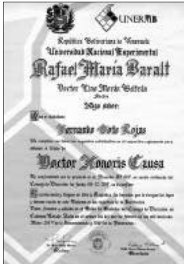
Título de Doctor Honoris Causa, otorgado por la Universidad Nacional Experimental Rafael María Baralt.