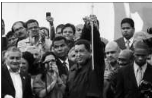
El presidente Hugo Chávez en la Plaza O'Leary, de Caracas, con la réplica de la espada del Libertador Simón Bolívar.