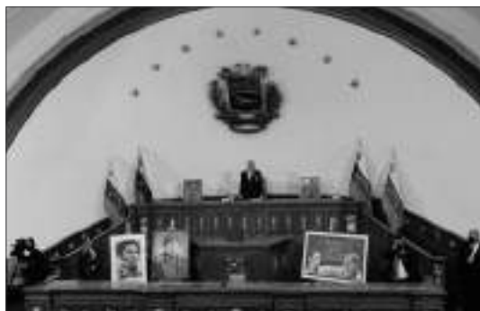
Soto Rojas en el hemiciclo protocolar.