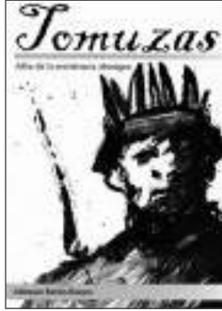
Portada del libro Tomuzas .

El tiempo... el tiempo... la historia... la historia... Solo el viento y las aguas conocieron de la existencia de los tomuzas, pero ahora la incógnita tiende a despejarse después de un largo silencio.