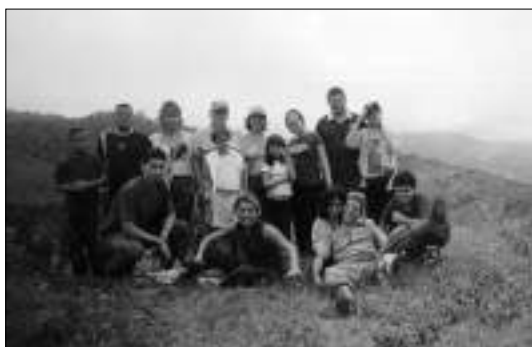
Viaje con hijos y nietos a las montañas del cerro El Bachiller en 2005.