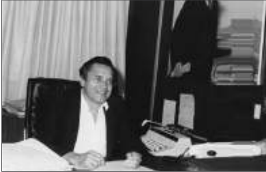
Preparando algunos elementos para la discusión política en función de la V Asamblea Plenaria de la Región Capital.