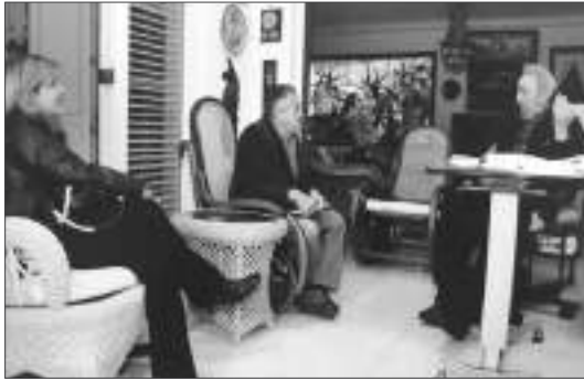
Visita de Fernando Soto Rojas a La Habana en el 2011. Reunión con Fidel Castro Ruz; a la izq. su hija menor, Vilma.

Palabras con motivo del 90.º aniversario de Fidel Castro Centro de Estudios Latinoamericanos Rómulo Gallegos, 13 de agosto de 2016