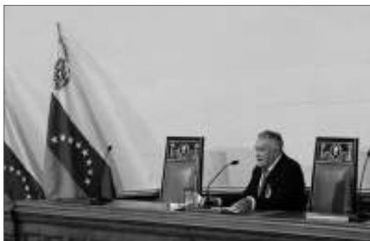
Luis Fernando Soto Rojas, presidente de la Asamblea Nacional.